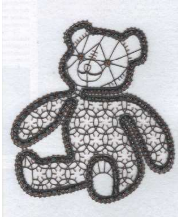
Sebastiana van den Herik ontwerp, uitvoering, tekst en tekeningen