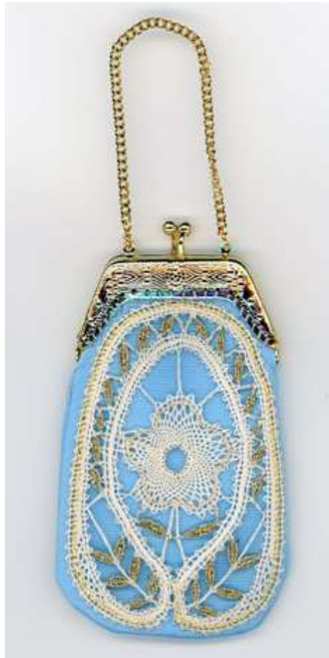
Ontwerp en uitvoering: Dini Boer-van der Pol