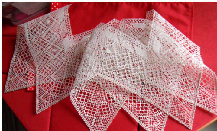
Kloswerk en foto, Steffi Reinhardt

Dit is het tweede patroon in de reeks LOKK-kerstpatronen in het kader van het corona-project.