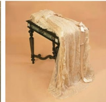
Doopjurk 1880 voor Prinses Wilhelmina.