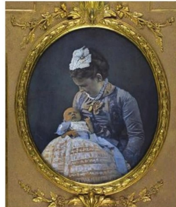
Moeder en Kind.