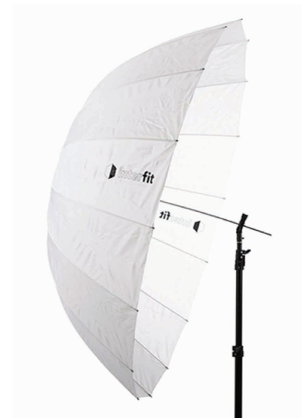
Paraplu voor de basis