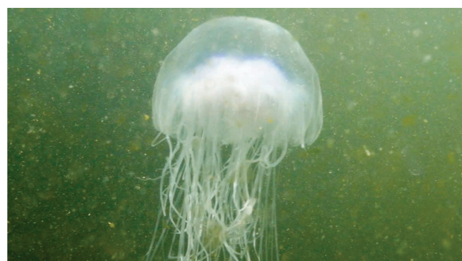
Zo ziet een kwal eruit

Ik verheug me op deze samenwerking en we gaan natuurlijk voor een indrukwekkend eindresultaat. Heel veel plezier en succes en ik zie jullie graag in 2020 in Leiden.